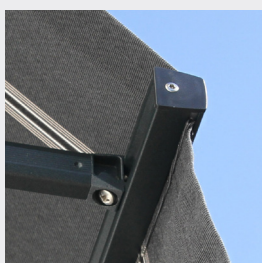
Standard frontprofil med kapp.